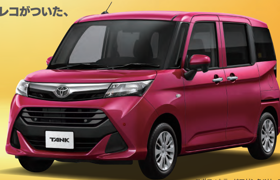
※ボディカラーはマゼンタベリマイカメタリック