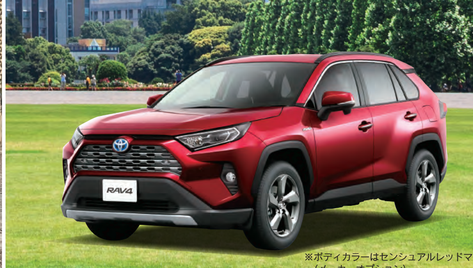
※ボディカラーはセンシアルレッドマイカ(メーカーオプション)