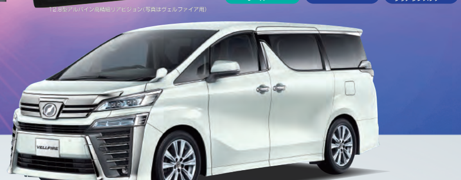
※ボディカラーはホワイトパールクリスタルシャイン(メーカーオプション)

※4WDはプラス194,400円となります。 ※7人乗りはプラス30,240円となります。