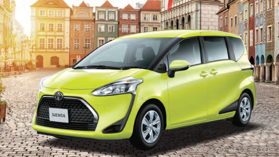
※ボディカラーはミッドナイトイロ