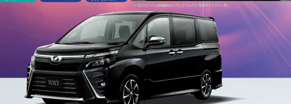
※ボディカラーはブラック