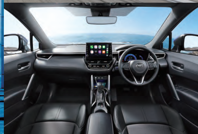
シックな雰囲気に包まれた、上質な室内空間。

※9インチディスプレイオーディオ+6スピーカー、おくたけ充電はメーカーオプション。