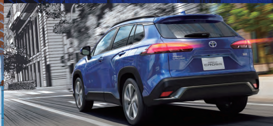
SUVならではの、広い視界と軽快な走り。