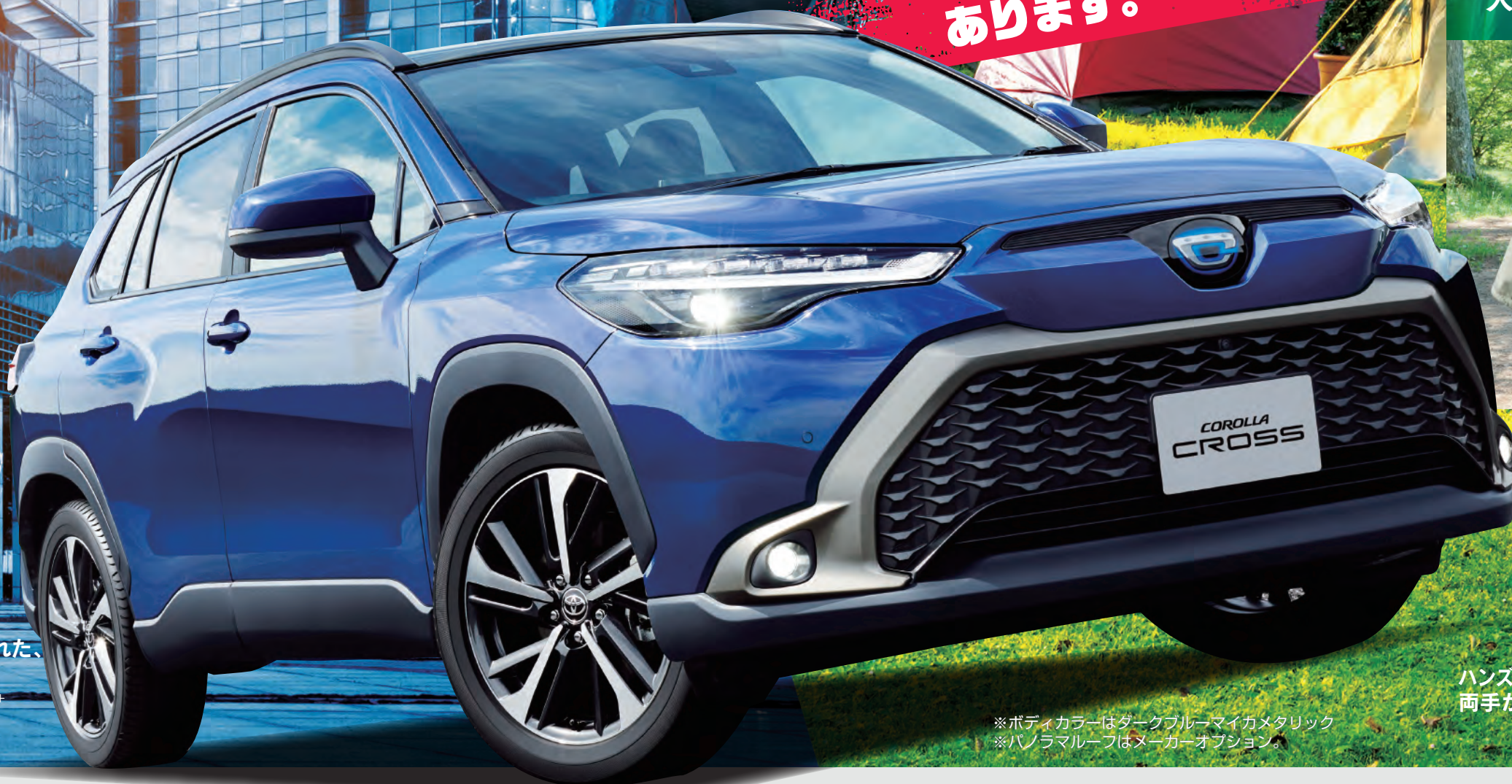
※ボディカラーはダークブルーマイカメタリック ※パノラマルーフはメーカーオプション。

※9インチディスプレイオーディオ+6スピーカー、おくたけ充電はメーカーオプション。