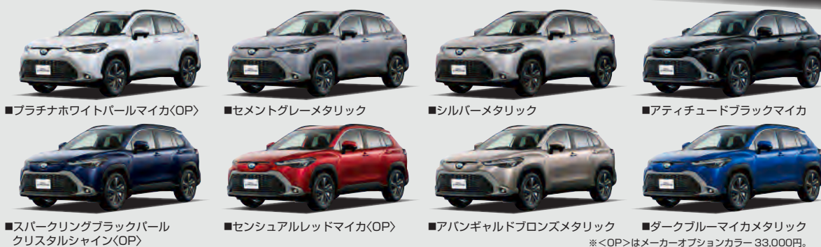
■プラチナホワイトパールマイカ(OP) ■セメントグレーメタリック ■シルバーメタリック ■アディチュドブラックマイカ ■ブラックリングブラックパールクリスタルシャイン(OP) ■センシアルレッドマイカ(OP) ■アパングアルドロンズメタリック ■ダークブルーマイカメタリック ※<OP>はメーカーオプションカラー。33,000円。