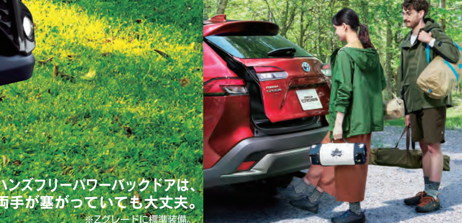
ハンズフリーパワーバックドアは、両手が塞がっていても大丈夫。

※写真は販売店装着オプションのラゲージアクティブボックス装着状態イメージです(スベアタイヤ、アクセサリ-コンセント[メーカーオプション]非装着車)。