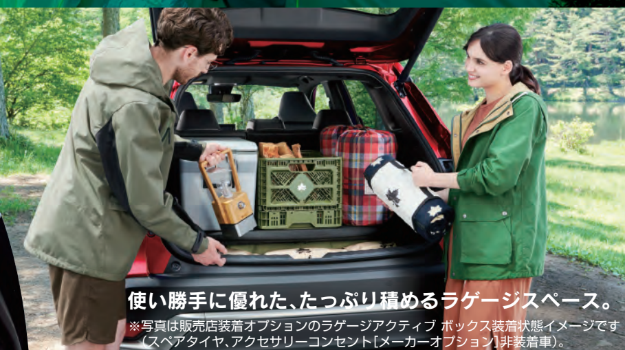
使い勝手に優れた、たっぷり積めるラゲージスペース。

※写真は販売店装着オプションのラゲージアクティブボックス装着状態イメージです(スベアタイヤ、アクセサリ-コンセント[メーカーオプション]非装着車)。